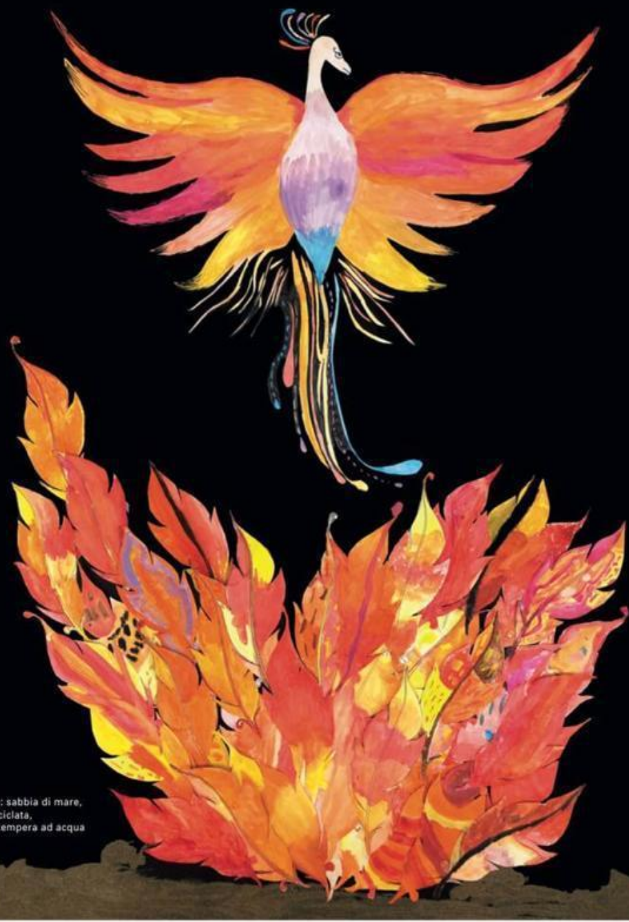
Collage: sabbia di mare, carta riciclata, colore tempera ad acqua

Illustrazione della Scuola Elementare Villaggio Primo Maggio Rimini